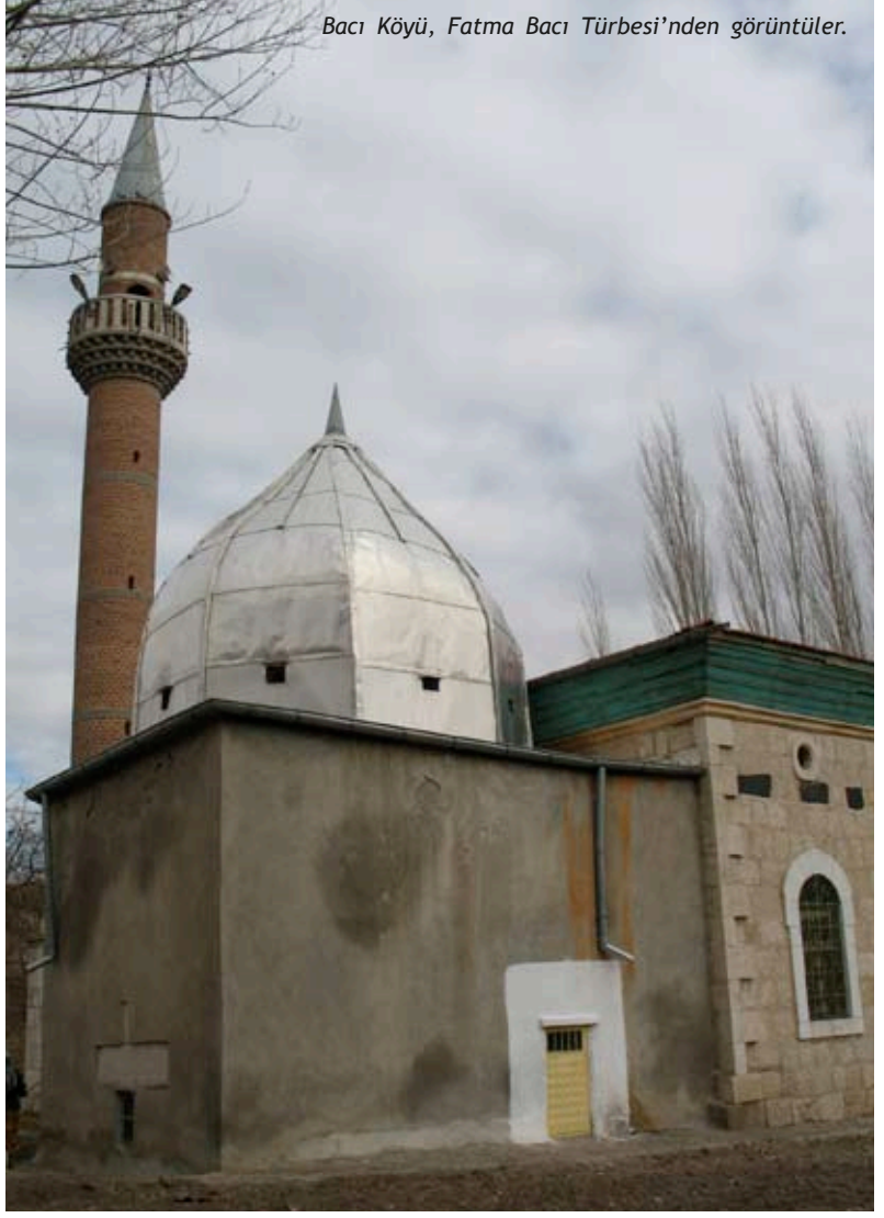
Bacı Köyü, Fatma Bacı Türbesi'nden görüntüler.