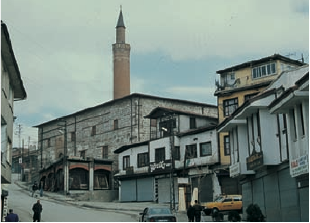
Ankara'da Ahi büyükler- inden Ahi Şerafettin'in yaptırıldığı Aslanhane Camii

merkezi idareye karşı "baş olma" gayreti olmamış, aksine merkezi idarenin zaafiyet gösterdiği zamanlarda, "fütüvvet" geleneğinin gereği mahalli güçlerin birlikteliği olur. Osmanlı'nın kuruluşunda büyük gayretleri olan Anadolu ahi büyüklerinin varlığı, tarihçiler tarafından kesin kabul görülür. Durum böyle olunca Osmanlı hakimiyet sahasına uzak olan Ankara, ahilerinin İlhanlılar idaresinde şehirde bağımsız hakimiyet kurmaları, bazı tarihçiler tarafından "ahi cumhuriyeti" olarak kabul edilir. Başbakanlık Vakıflar Genel Müdürlüğü Arşivi'nde "Ahi Şerafeddin"e ait orijinal şecere bulunmaktadır 16 .