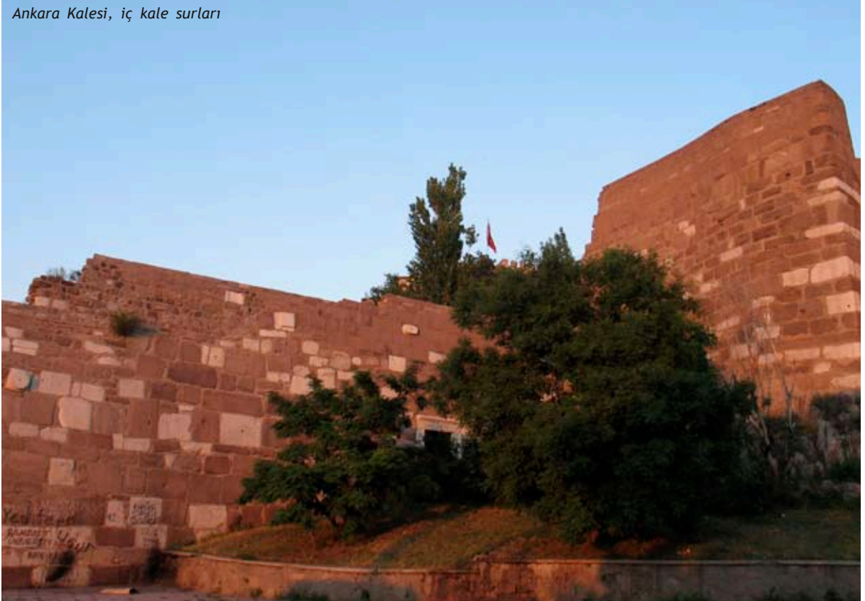
Ankara Kalesi, iç kale surları

27 Agustos Cuma günü iki ordu Malazgirt ovasında savaş düzeni alır. Sultan Alparslan'ın asker sayısı altmış bin, Bizans ordusunun savaş silahları oldukça üstün ve çeşitlidir. Alparslan'ın yanında Savtekin, Gevherayin, Afşin, Saltuk, Tarançoğlu, Ahmedşah, Dilmaçoğlu, Artuk ve Tuti gibi meşhur Türk komutanlar bulunur. Ayrıca Bizans gazalarında tecrübe