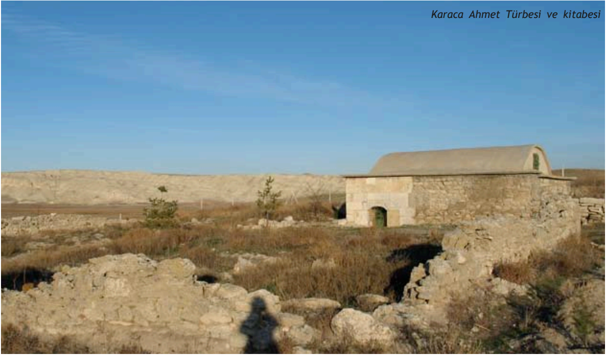
Karaca Ahmet Türbesi ve kitabesi

Yakınında ve tepe üstünde kare planlı, harap olmuş Çile Dede Türbesi vardır.