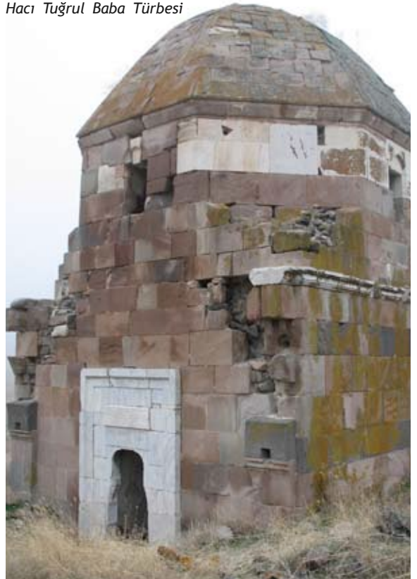
Hacı Tuğrul Baba Türbesi

Kare planlı, külahlı bir yapı olan türbenin kenarları 6,65 metre, duvar kalınlıkları 1 metredir. Türbenin kübik gövdesinin iki cephesi sağır, bir cephesinde kapı diğer cephesinde iki pencere