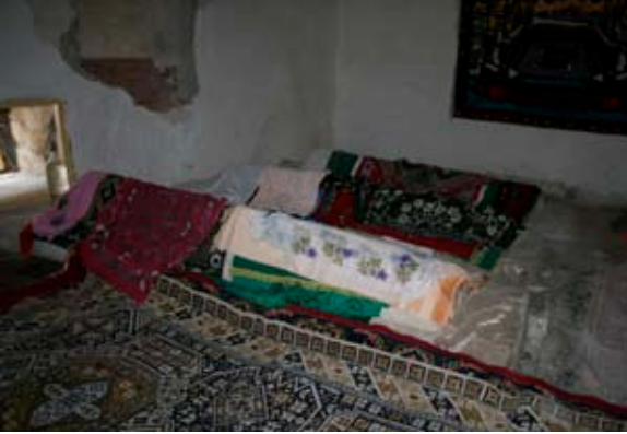
Fatma Bacı mezarı