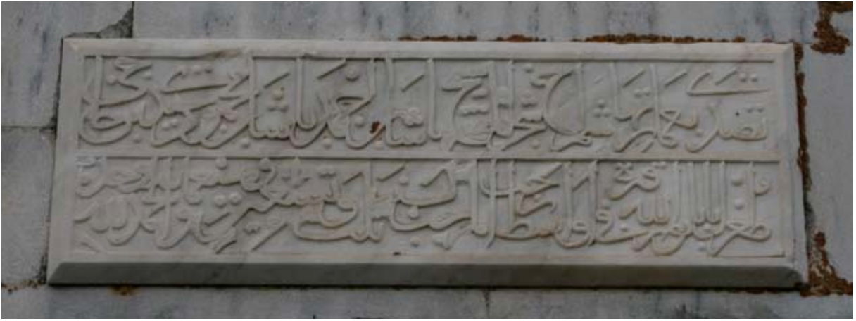
Hacı Tuğrul Baba Türbe Kitabesi ve kırılan pencere yapı elemanları